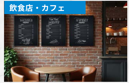
ランチ／ディナーのメニュー切り替え、期間限定メニューの告知