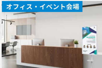
会社・会場案内、受付案内、イベント告知