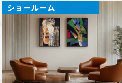
製品デモンストレーション、ご案内