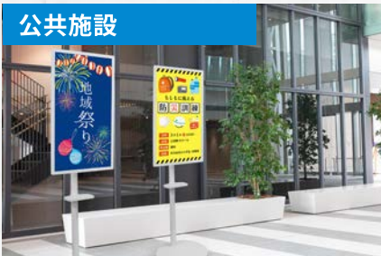
イベント情報・告知、お知らせ