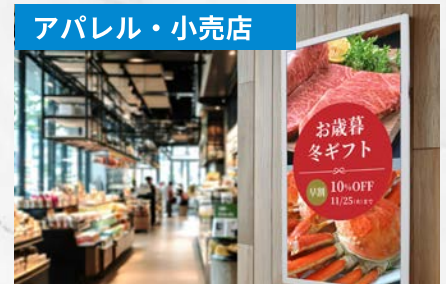
特売品、セール情報、告知