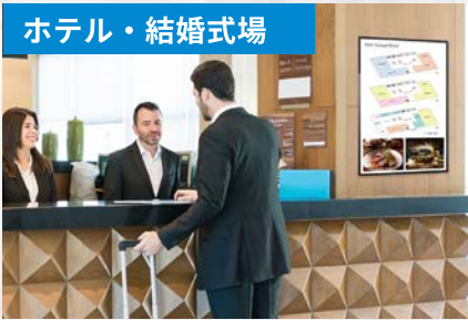
会場案内、イベントスケジュール表示、ウェルカムボード